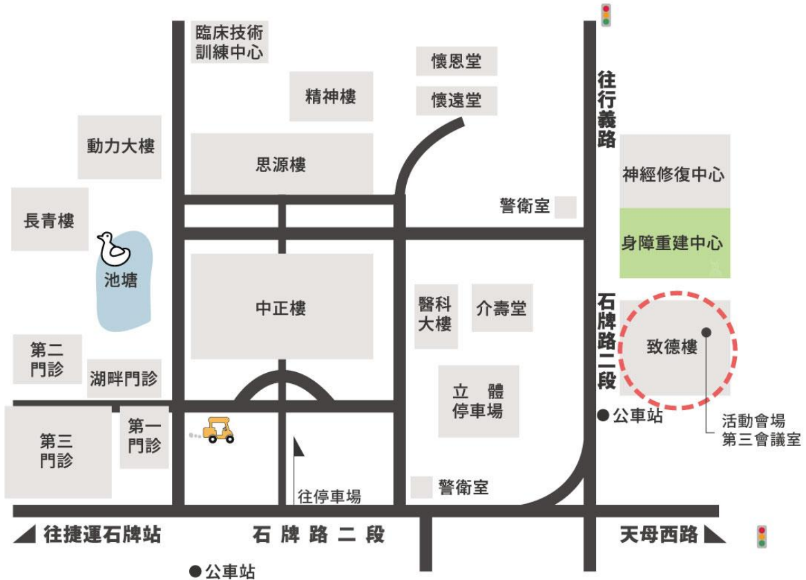
工作坊會場平面圖

自行開車 | 可停本院立體停車場或地下停車場，再步行至致德樓 日間收費40元/時